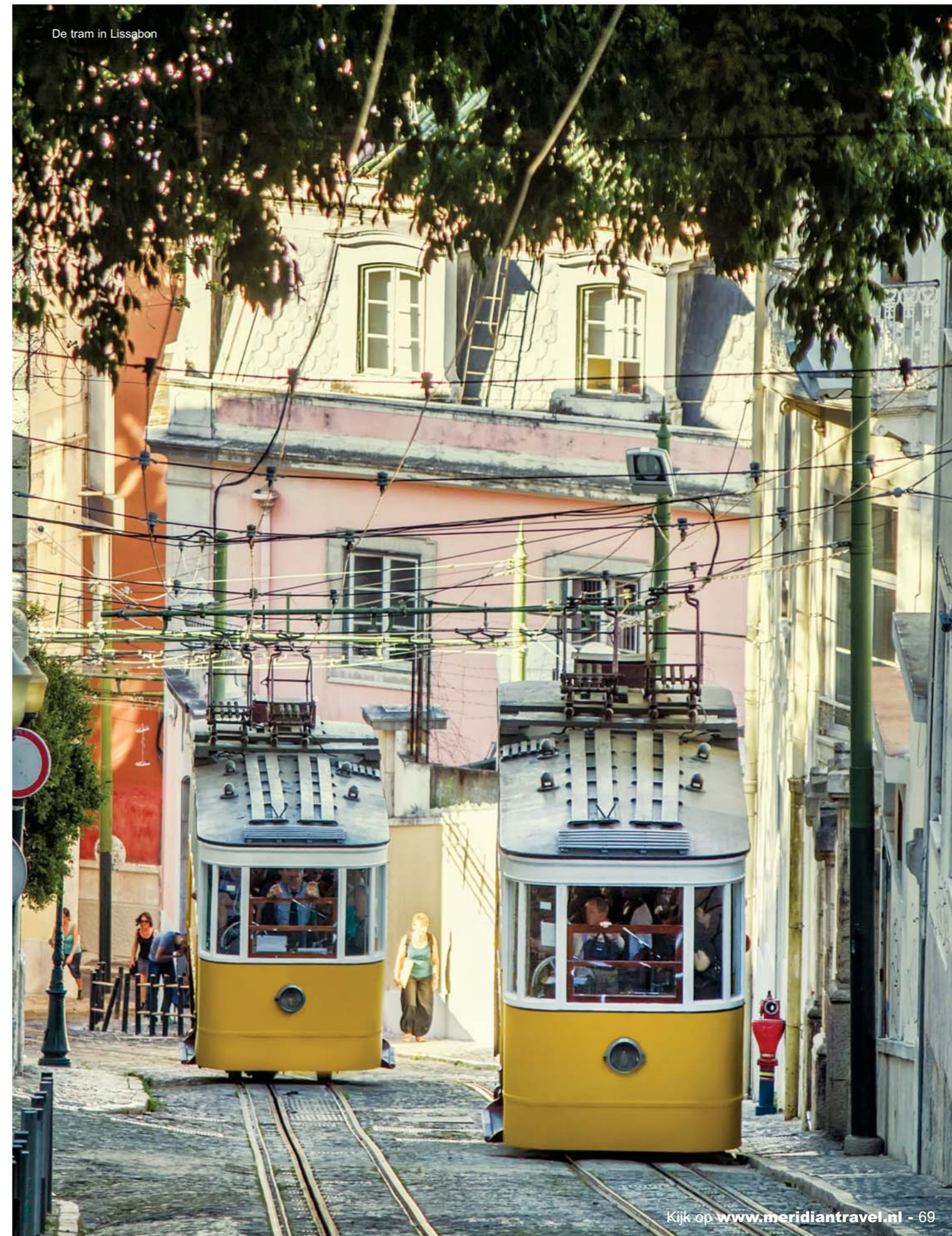
De tram in Lissabon