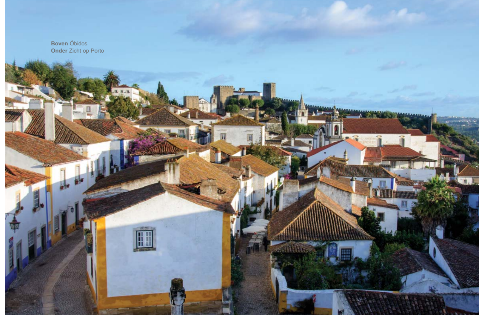
Boven Óbidos Onder Zicht op Porto